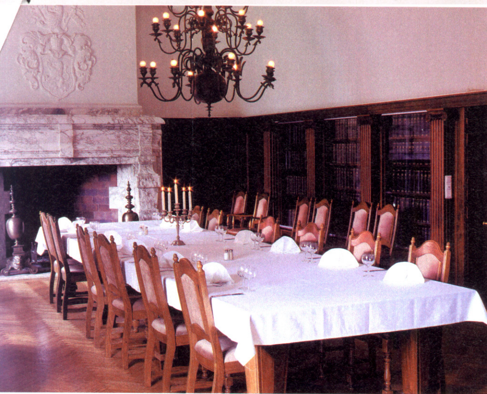
Ruokasali on alkuperäisessä asussaan. Sen seinäpaneelit ovat intialaisesta mahongista.

– Linna on pyritty palauttamaan mahdollisimman lähelle alkuperäisasuaan ja -tunnelmaa. Vierailu linnassa on elämys, joka ylittää normaalin arjen, toteaa Walkamo.