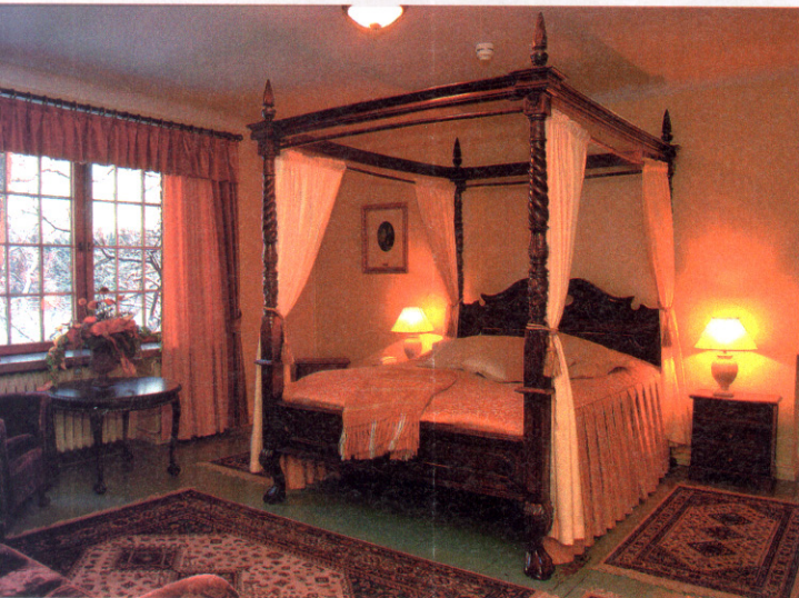
Vanajanlinnassa on 63 korkeatasoista huonetta, joista kuusi on antiikki-huonekaluin sisustettuja sviittejä. Kuvassa hääsviitti.

la olevista materiaaleista: tammesta, marmorista ja graniitista. Linnan aulassa on doorialaiset pylväiköt, päärakennusten saleissa erimalliset, koristeelliset kasettikatot. Kaikki ikkunapenkit ovat marmoria, jota tuotiin Karjalasta ja Italiasta saakka. Arkkitehtuuri ilmentää 1910- ja 1920-luvun taitteessa vallinneita arkkitehtuurivirtauksia, muun muassa barokkia ja renessanssia.